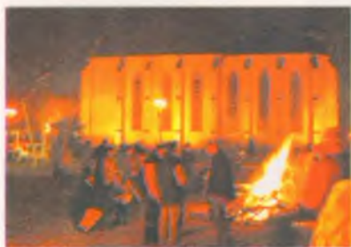
Karácsonyi pásztor tűz

A hagyományokhoz híven Nyírbátor önkormányzata és a helyi Kulturális Központ 2007. december 23-án ugyancsak közösen örvendeztette meg a város lakóit a Bátori Karácsonnyal a Papok rétjén. A hideg idő ellenére a városi karácsony ezúttal is több száz embert csalogatott ki a nyírbátori szabadtéri események egyik legjellemzőbb helyszínére. Az érdeklődők természetesen most is pásztor tűzek mellett melegedhettek, miközben ízletes forralt bor, meleg tea, szaloncukor, zsíros kenyér, főszlós kalács és egyéb karácsonyi sütemények is várták az érdeklődőket a nyírbátori civil – és egyéb közhasznú szervezetek jóvoltából. A 2007-es Bátori Karácsonyon a Vasas Horgász Egyesület ezúttal is inycsiklandozó halászlével kívánt a látogatók kedvében járni. A siker ezúttal is önmagáért beszélt. Most sem maradt el a színpadi program: az ünnepi köszöntőket a Talán Teátrum „Csillag születik” című műsora követte a Papok rétjén.