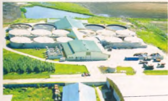
A Biogáz Üzem madártávlatból

Gondolnák-e, hogy Nyírbátor egész évi áramszükségletét is fedezhetné akár a város határában működő, világhírű Biogáz Üzem? S hogy mi köze ennek a Magyar Filmszemléhez? Csupán annyi, hogy a téma felvevőgépért kiállt, az ősbemutató pedig megfelelő körítést kapott.