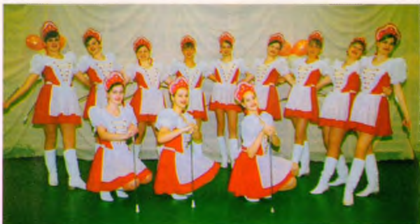
Szép, fiatal lányok, libbenő szoknyák, hajlékony derekak, egyszerre mozduló lábak és karok – a mi mazsorettjeink, akik rendre elvarázsolják a közönséget