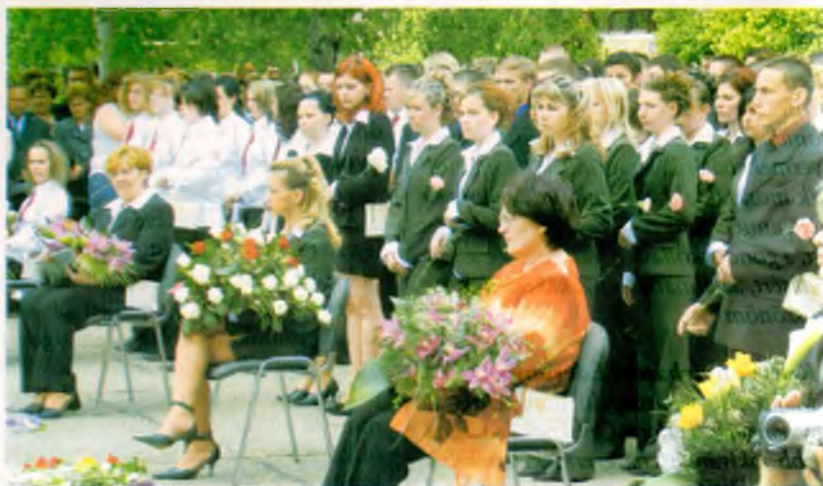
Nyírbátor két középfokú oktatási intézményében 309 tanuló tesz az idén érettségi vizsgát. A diákok május 6-án búcsúztak az iskoláktól.