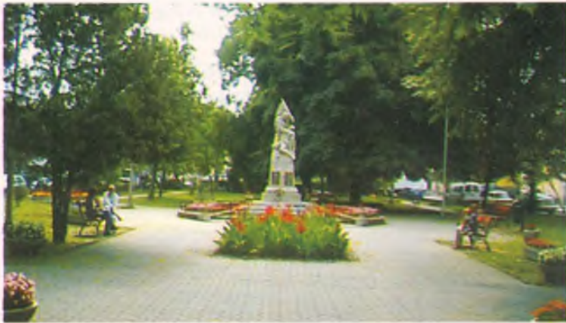
Senki nem vitathatja, a virágok megszépítik a várost

Nyírbátor önkormányzata és a Nyírbátori Városüzemeltetési Kiemelten Közhasznú Társaság benevezett az országos „Virágos Magyarországért” virágosítási, parkosítási és környezet-szépítő versenyre.