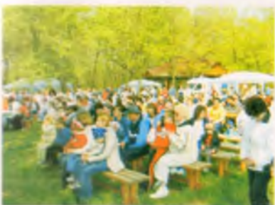
és a közönség...