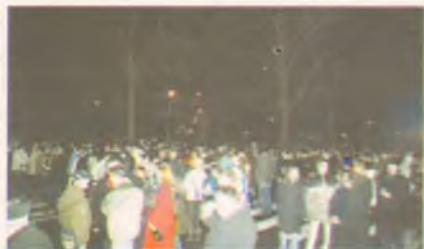
Több, mint kétezren gyűltek össze szilveszter éjjel a Szabadság téren, hogy együtt köszöntsék a 2006-os évet, no és gyönyörködjenek a látványos tűzijáték égi csodáiban.