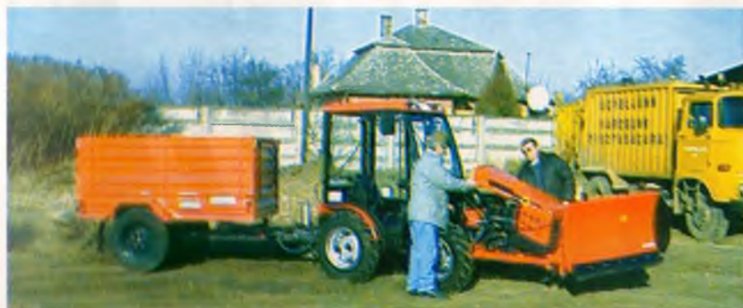
A minőségi szolgáltatás javítása érdekében korszerű kommunális traktort és tartozékokkal bővítette gépparkját a Nyírbátori Városüzemeltetési Kkht.