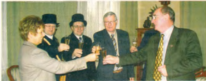
Újévi jókívánsággal kéményseprők jártak városunk polgármesterénél

letet. Megfordítottuk a régi gyakorlatot. Nem azt nézzük, hogy milyen pályázatot ír ki a megye, a régió, vagy mások, és arra próbálnánk ráilleszteni valamit. Éppen fordítva tesszük: a számunkra fontos dolgokat gyűjtjük csokorba, azokból projekteket alkotunk, s azokat nyújtjuk be, ha alkalom nyílik. Annak érdekében, hogy ez szakszerű és eredményes legyen, a városfejlesztési csoportnál létrehoztunk egy irodát, ahol különböző képesítésű szakemberek dolgoznak, akik járatosak az önkormányzati és az uniós ügyekben is. Ráadásul nem csak a pályázás a feladatuk, hanem a nyertes pályázat menedzselése, a közbeszerzési eljárások, az egész beruházás lebonyolításának figyelemmel kísérése.