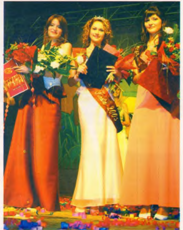
A tavalyi döntősök

A Kölcsey Televízió adását Nyírbátorban antennán az UHF 52-es csatornán, kábelen a Béta program csomagban, a 21-es csatornán lehet fogni.