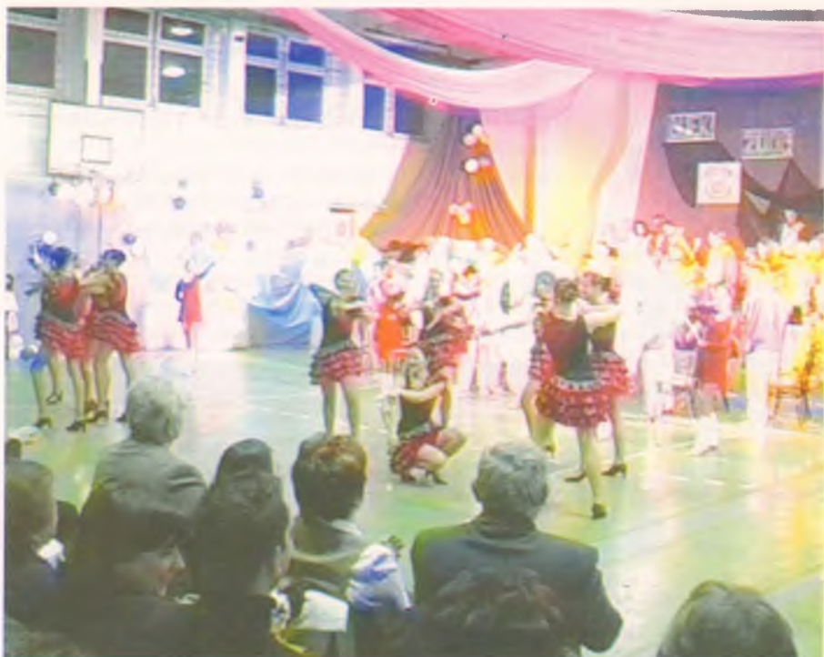
Több száz néző előtt mutatott be nagyszerű, vérpezsdítő újévi koncertet január 1-jén a Bátor Majorett Csoport és a Nyírbátori Koncert Fúvós Zenekar a Hunyadi Mátyás Általános Iskola tornatermében.