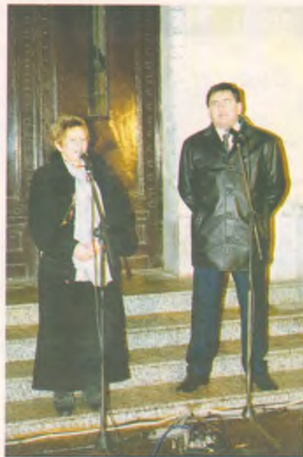
A polgármester és a pénzügyminiszter szabadtéri óévűcsúztatója