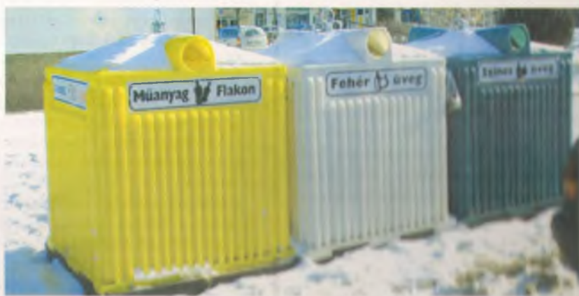
A fehérbe a fehér, a zöldbe a színes üveget, a sárga konténerbe a műanyag palackokat kell bedobni

A nyírbátori önkormányzat 2005-ben az Észak-Alföldi Regionális Fejlesztési Tanács települési hulladék pályázatán 1 millió 946 ezer forintot nyert gyűjtőszigetek kialakítására, melyet az önkormányzat 835 ezer forint saját erővel egészített ki. A pályázatban öt gyűjtősziget létrehozását vállalta az önkormányzat: a víztoronynál, a Báthori ABC-nél, a Hunyadi lakótelepen, a Fáy utcai lakótelepen, és a Zrínyi Erzsébet úti parkolónál. Ezek mellett – saját erőből – a Zrínyi-Károlyi úti tömbbelsőben is létesített egyet