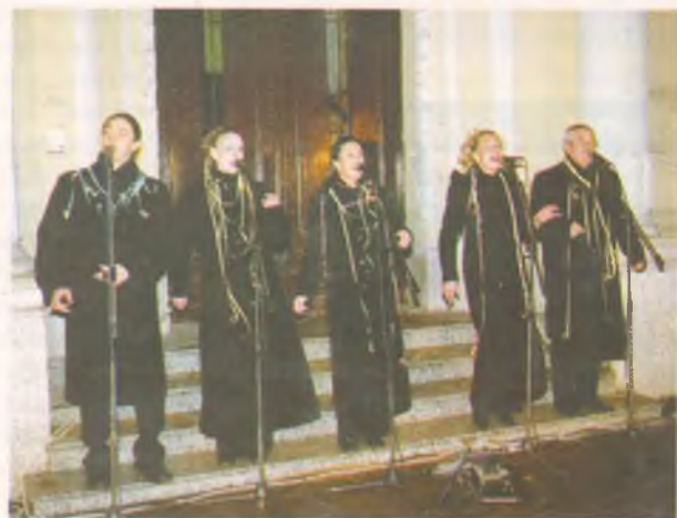
A Talán Teátrum énekesei jó hangulatú zenei műsorral köszöntötték az új évet