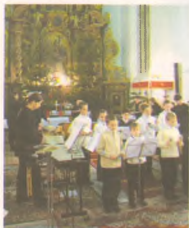
Zsúfolásig megtelt én a római katolikus templom, ahol a város több művészeti együttese adott közös adventi hangversenyt