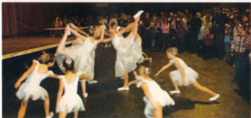
A Gabriella Mozgásművészeti Stúdió kis balerináinak előadása

Vidám gyermek zsvajtól volt hangos a nyírbátori Kulturális Központ épülete 2008. november 30-án, vasárnap.