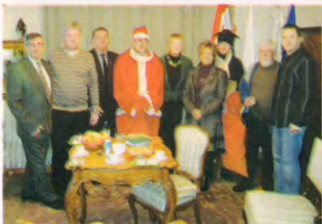
Lengyelországi testvérvárosunk, Rawa Mazowiecka képviselői a Nyírbátori Tűzoltóság 125 éves évfordulójának alkalmából ismét tiszteletüket tették városunkban. A vendégeket nemcsak a város vezetői, de maga a Mikulás is fogadta.

A járdák, közterületek és buszvárók hóeltakarítását és síkosság-mentesítését 35 közcélú dolgozó foglalkoztatásával tervezi megoldani a Kft.