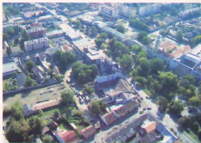
és ma – madártávlatból